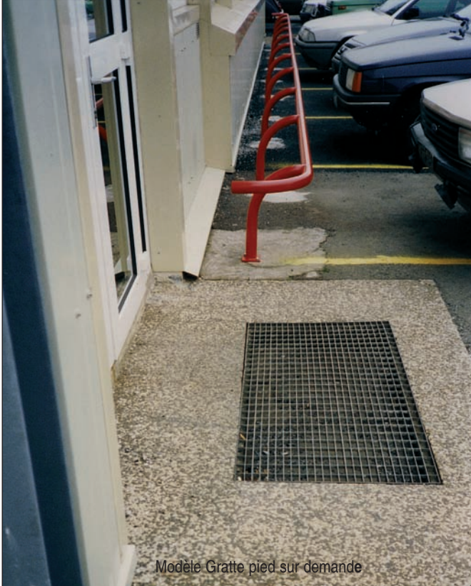
Modèle Gratte pied sur demande