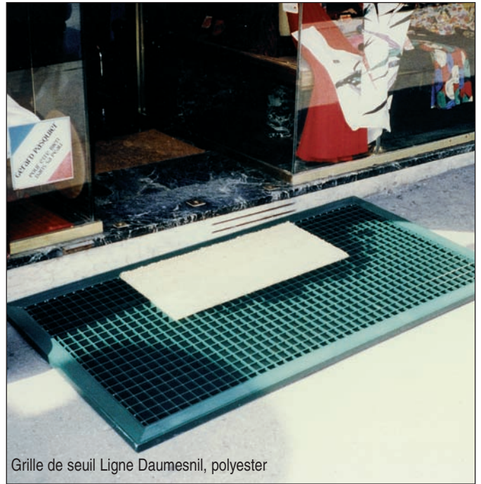
Grille de seuil Ligne Daumesnil, polyester